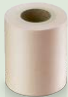
Brun naturel – pour un look durable (film en papier composite brun)