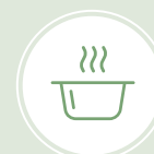
Résistent à la chaleur