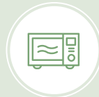
Adaptées au micro-ondes et au four