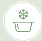
Se prêtent à la congélation